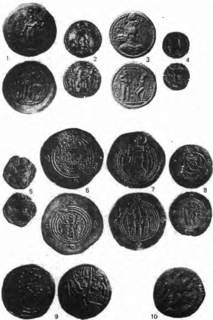
نمونه ی (٥)